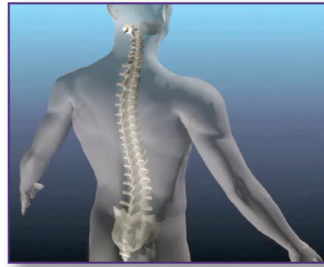
A Body Viewer Training Program